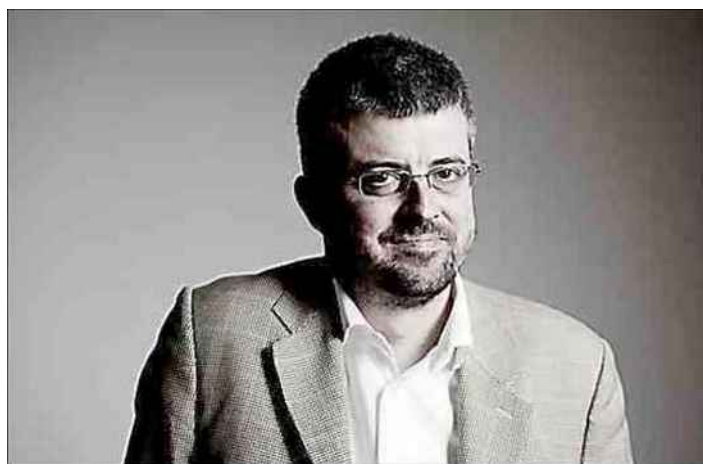
Guillaume de Fonclare fait redécouvrir le destin du poète.

Un livre qui doit faire redécouvrir ce destin tragique, vé-