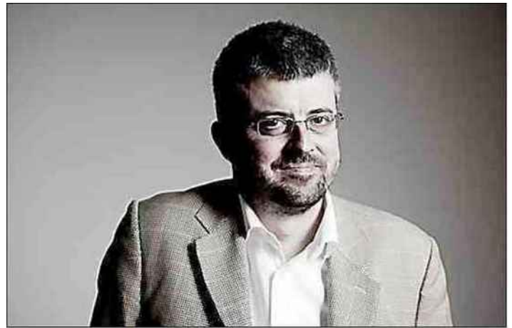
Guillaume de Fonclare fait redécouvrir le destin du poète.

Un livre qui doit faire redécouvrir ce destin tragique, vé-